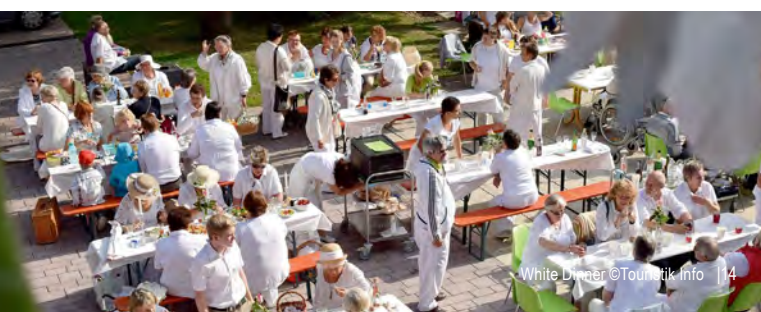
White Dinner