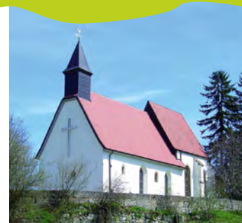
Kirche Gruorn

Kirchenführungen sind unter www.muensingen.com buchbar.