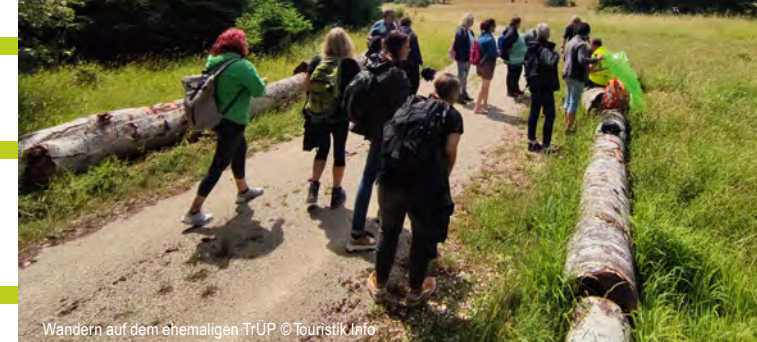
Wandern auf dem ehemaligen TrÜP