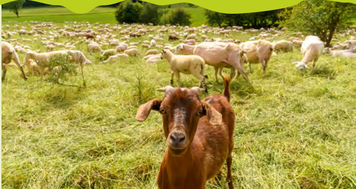
Schafe und Ziegen auf dem ehemaligen TrÜP

Bei Interesse werden ab sofort TrÜP-Touren für Schulklassen angeboten. Diese sind in Kooperation mit der BIMA und dem Biosphärengebiet entwickelt worden. Sechs TrÜP-Guides bieten Touren mit verschiedenen Schwerpunkten und Startpunkten an. Dabei wird auch auf die Wünsche und die Bedürfnisse der Schulklassen, bzw. des Lehrpersonals eingegangen. Weitere Informationen finden Sie unter: www.muensingen.com . Gerne senden wir Ihnen auch einen separaten Flyer: „TrÜP-Touren für Schulklassen“ zu. Tel. 07381/182145 oder touristinfo@muensingen.de